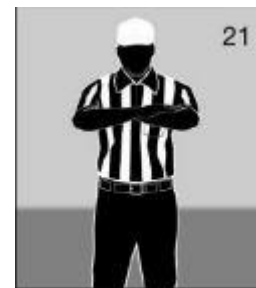
Delay of game