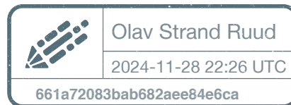
Olav Strand Ruud